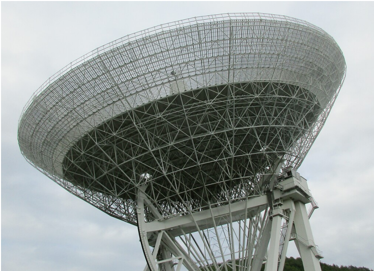
Das Radioteleskop Effelsberg bei Bad Münstereifel gehört mit 100 Meter Durchmesser seines Parabolspiegels zu den größten vollbeweglichen Radioteleskopen der Erde (2020).