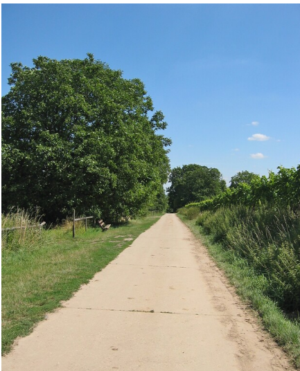
Kühohl zwischen Erbach und Eberbach mit Nussbäumen (2005)