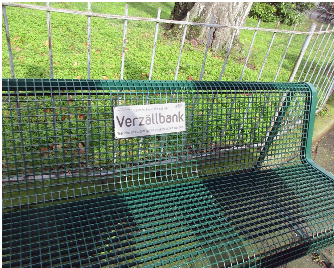
Eine "Verzällbank" auf dem früheren namenlosen Dorfplatz von Köln-Riehl, dem so genannten "Riehler Plätzchen" (2020).