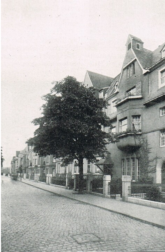
Evangelische Kirche Köln-Riehl Betsaal (Gemeindehaus)

Historisches Foto der späteren Kreuzkapelle in Köln-Riehl, aufgenommen anlässlich der Weihe zur evangelischen Kirche am Ersten Advent 1911.