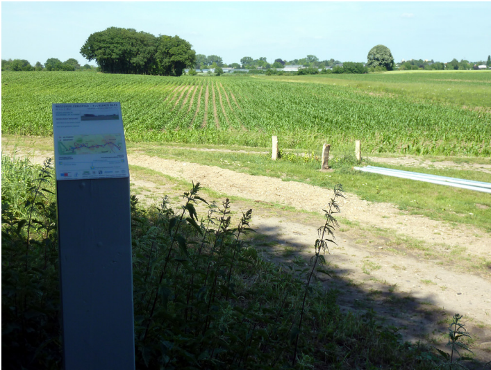
Abbildung 1: Erzählstation Rheinrinne (2011)