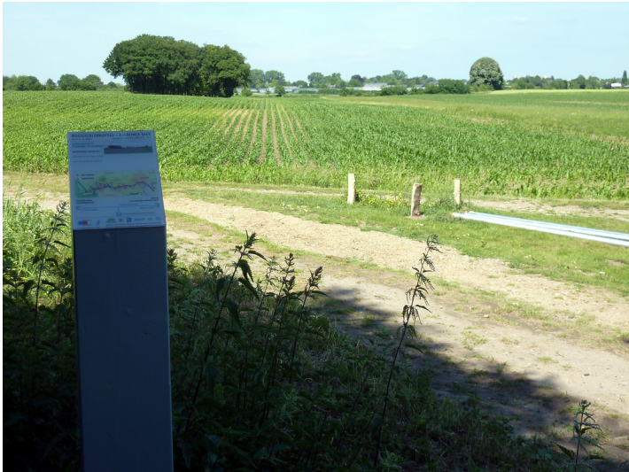
Abbildung 1: Erzählstation Rheinrinne (2011)