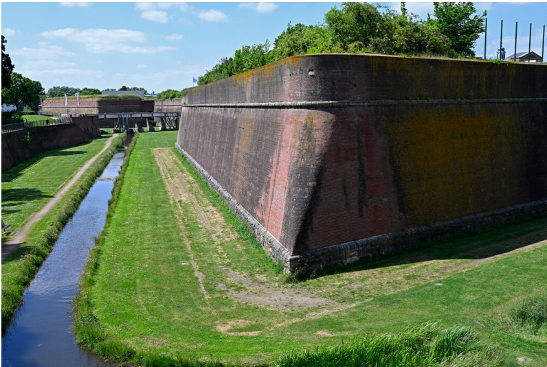
Zitadelle Jülich (2025)