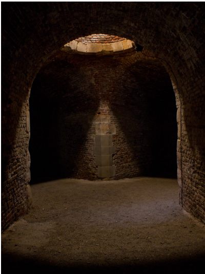
Kasematten in der Zitadelle Jülich (2017)