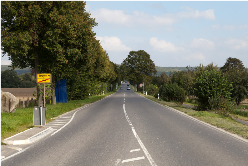
Jülich, Römerstraße