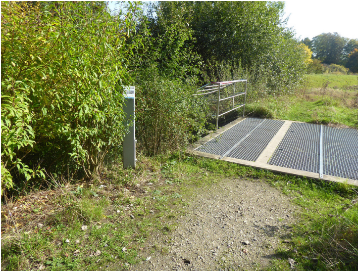
Abbildung 1: Erzählstation Hochwasserrückhaltebecken Bendacker (2019)