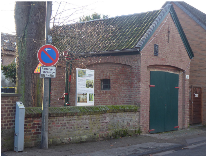
Abbildung 1: Erzählstation Pumpe am Spritzenhaus (2019)