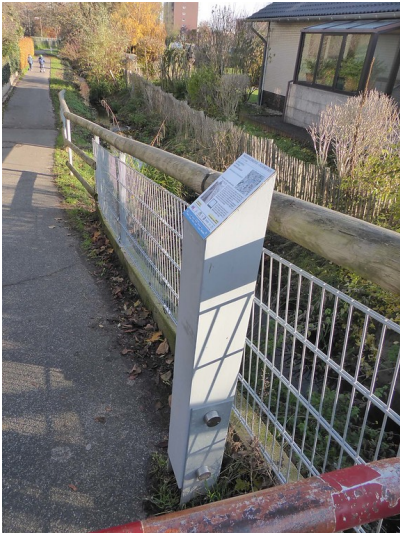
Abbildung 1: Erzählstation Verrohrung in Pulheim-Sinthern (2019)