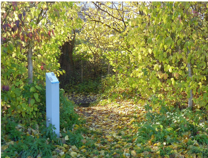
Abbildung 1: Erzählstation Kalksinter Abtsmühlenbach (2019)