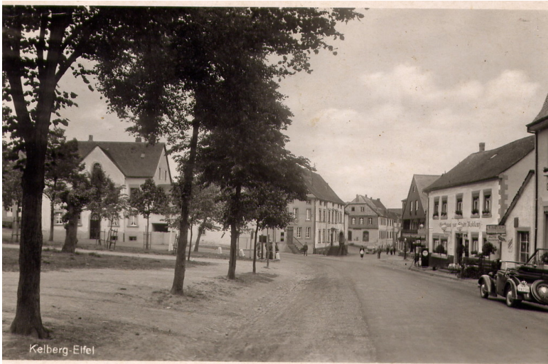
Ansicht des Ortszentrums in Kelberg vor den Luftangriffen der Jahre 1944/1945