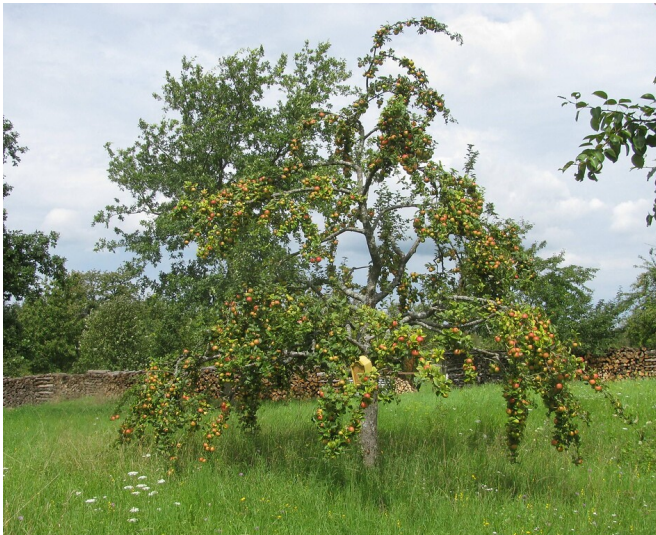
Apfelbaum bei Büchelberg (2011)