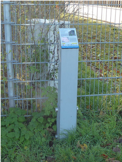
Abbildung 1: Stele und Hinweistafelchen zur Erzählstation 7 Wasserturm (2019)