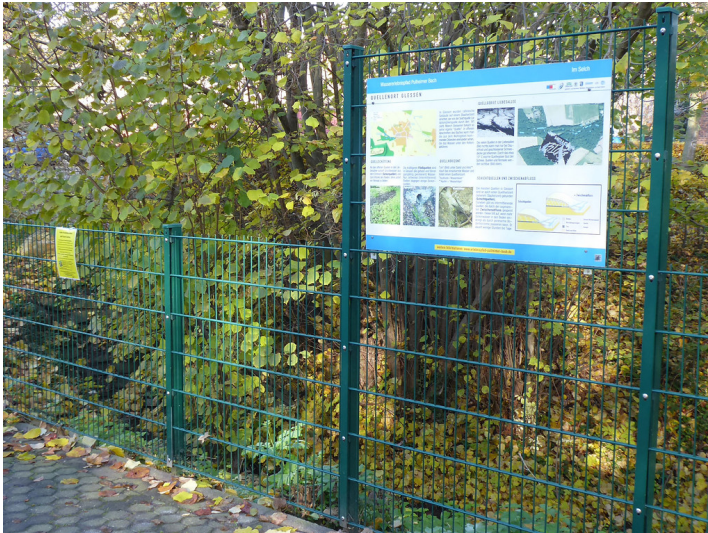
Abbildung 1: Erzählstation Quellenort Glessen (2019)