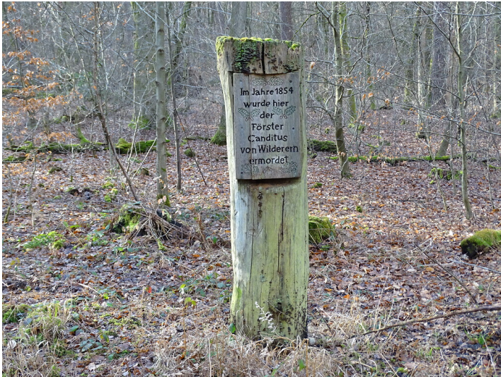
Gedenkstätte Candidus im Bienwald (2020)