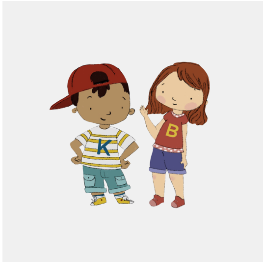
Hallo, wir sind Kamp und Bornhofen und zeigen dir, welche Texte für Kinder sind (2019)