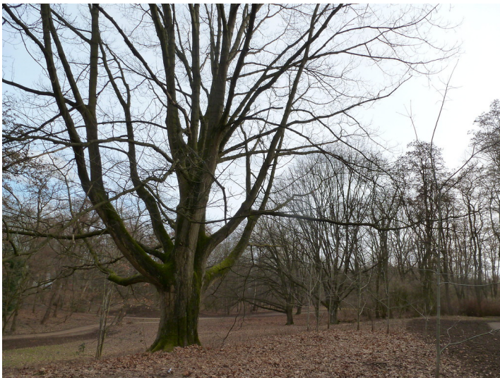
Alte Eiche auf dem Trümmerberg in Longerich (2014)