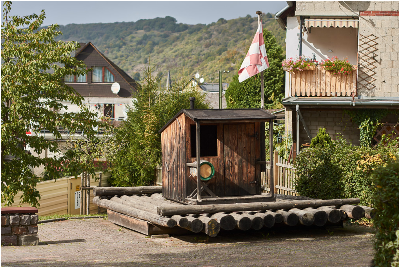
Floß auf dem Kinderspielplatz in der Marienstraße in Kamp-Bornhofen (2019)