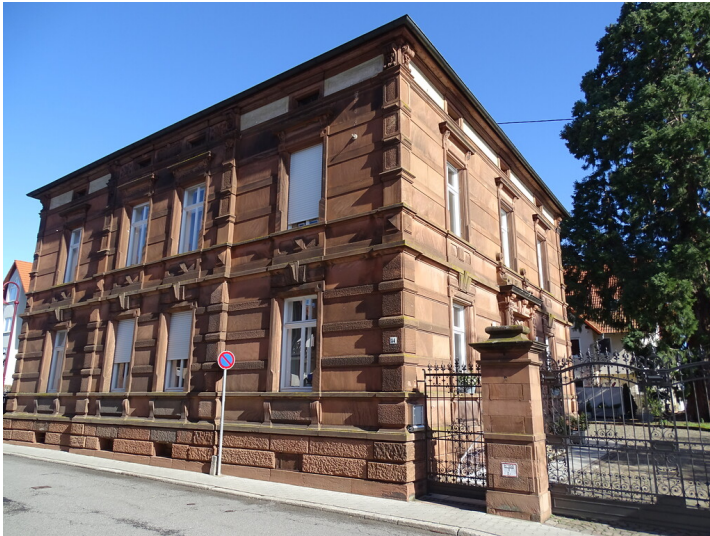
Gründerzeitvilla Weinstraße Nord 54 in Maikammer (2020)