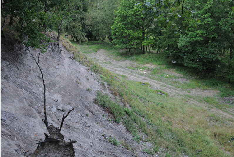
Naturschutzgebiet "Grube Weiß" (2019)