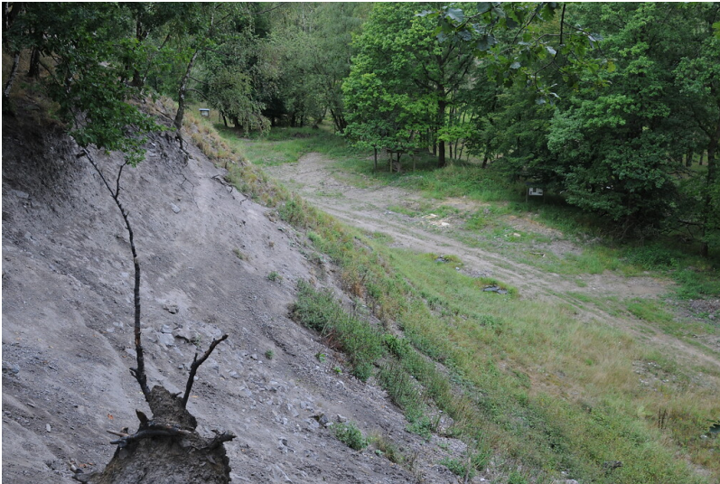
Naturschutzgebiet "Grube Weiß" (2019)