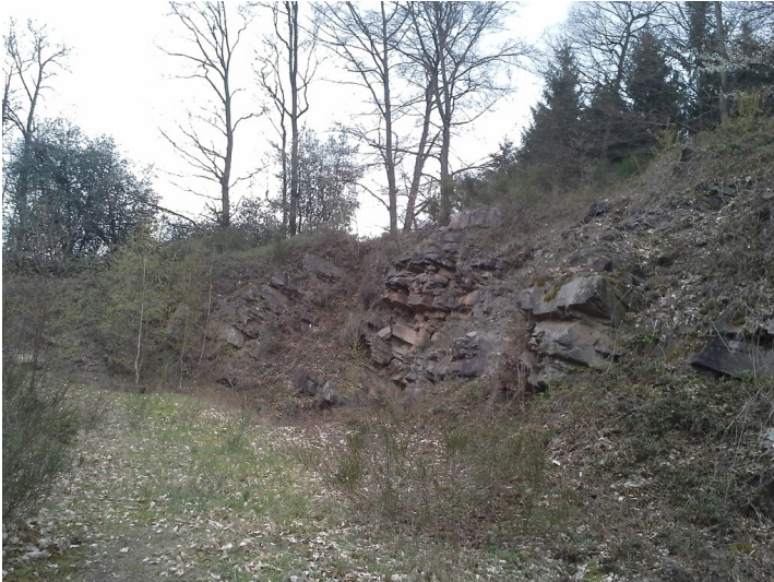
Naturdenkmal "Steinbruch bei Breidenassel" (2019)