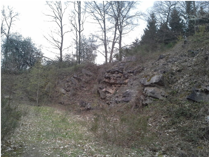
Naturdenkmal "Steinbruch bei Breidenassel" (2019)