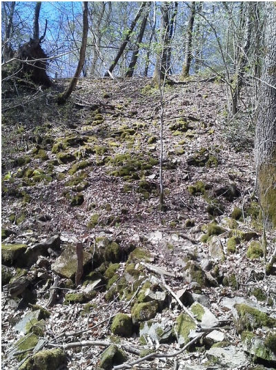
Naturschutzgebiet Felsenthal (2019)