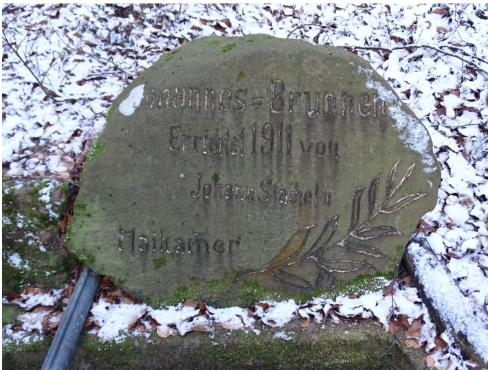
Johannes=Brunnen beim Totenkopf bei Maikammer (2019)