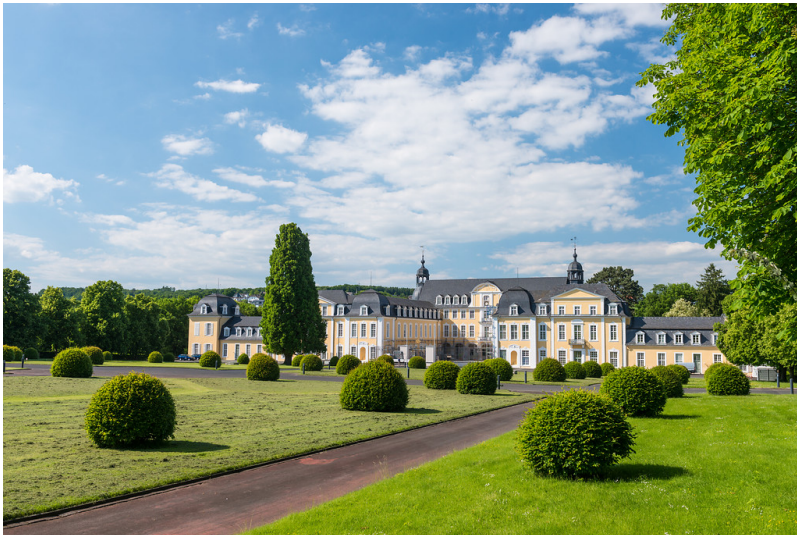
Blick auf Schloss Oranienstein in Diez aus südlicher Richtung (2013)