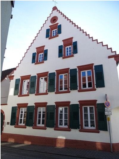
Renaissancegebäude Hartmannstraße 7 in Maikammer (2020)