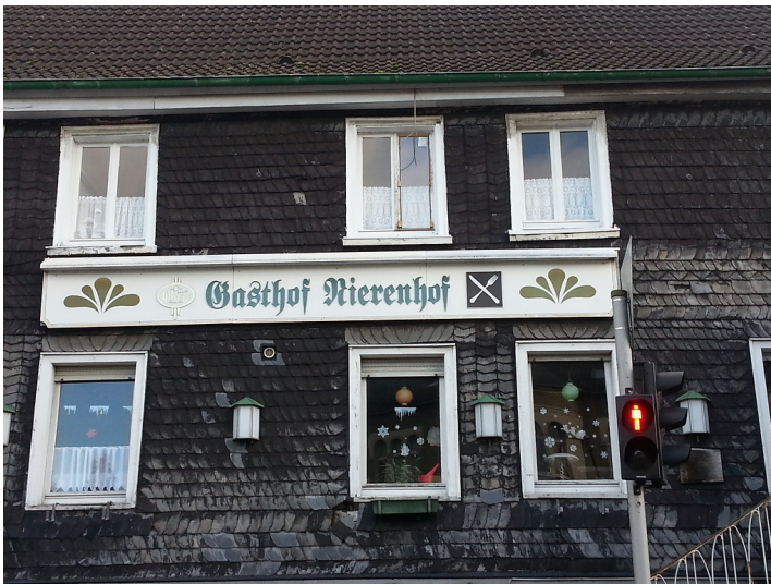
Gut Nierenhof in Velbert (2019)