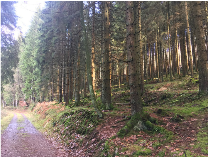
Historischer Meilerplatz am Fuß des Unnenbergs in Marienheide (2019)