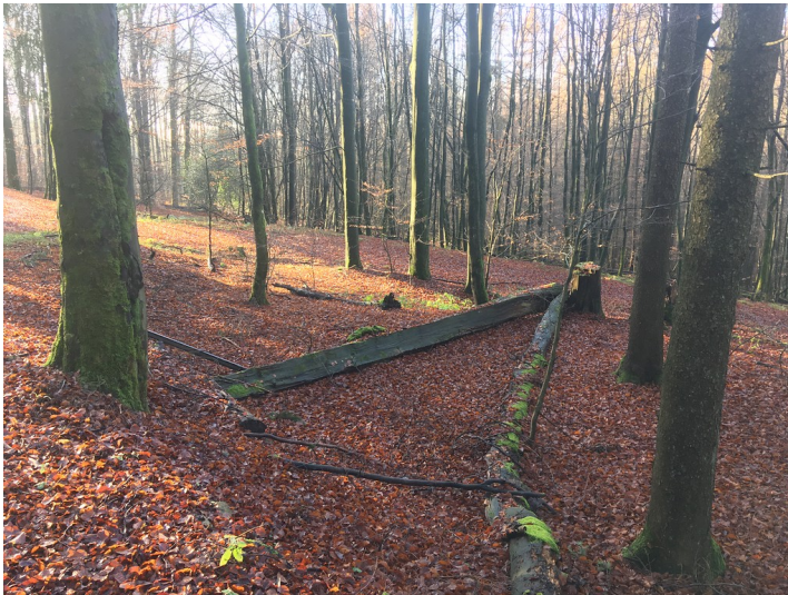
Historischer Meilerplatz im Naturschutzgebiet Puhlbruch bei Reichshof (2019)