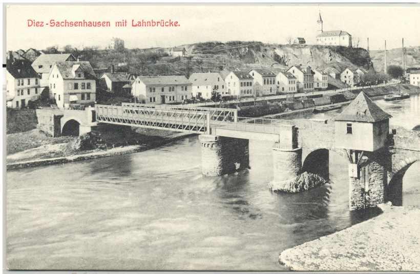
Historische Postkarte mit Blick auf die Alte Lahnbrücke in Diez (gelaufen um 1910)