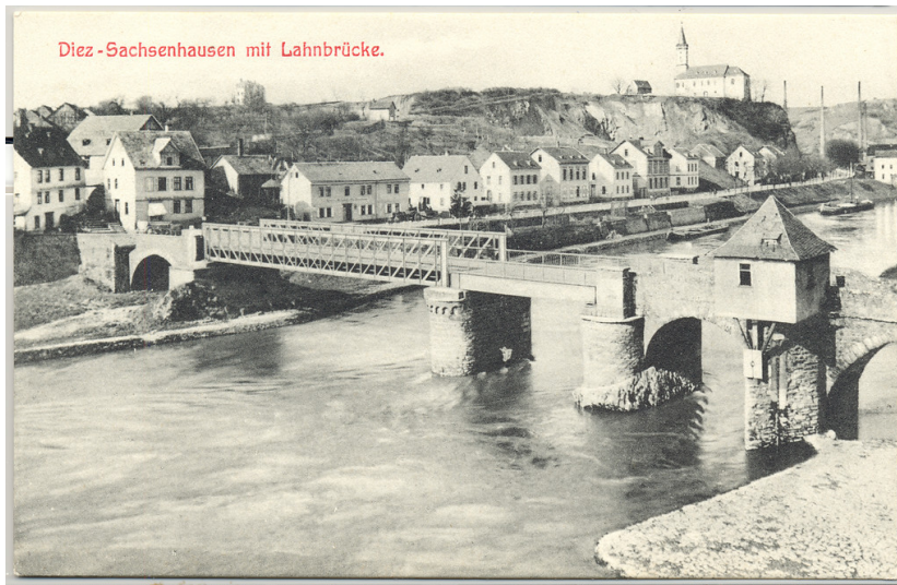
Historische Postkarte mit Blick auf die Alte Lahnbrücke in Diez (gelaufen um 1910)