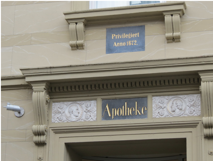
Die beiden schwarzen Tafeln oberhalb des Eingangs zur Amtsapotheke in der Wilhelmstraße 9 in Diez (2019)