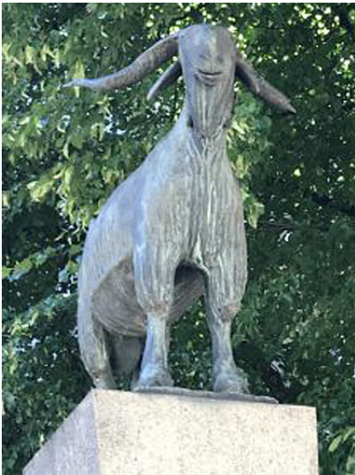
Ziegen- bzw. Geißbock "Deutzer Bock" auf dem Deutzer Platz "Am Düxer Bock" (2018), die Tierfigur ist ein Werk von Gerhard Marcks (1889-1981).