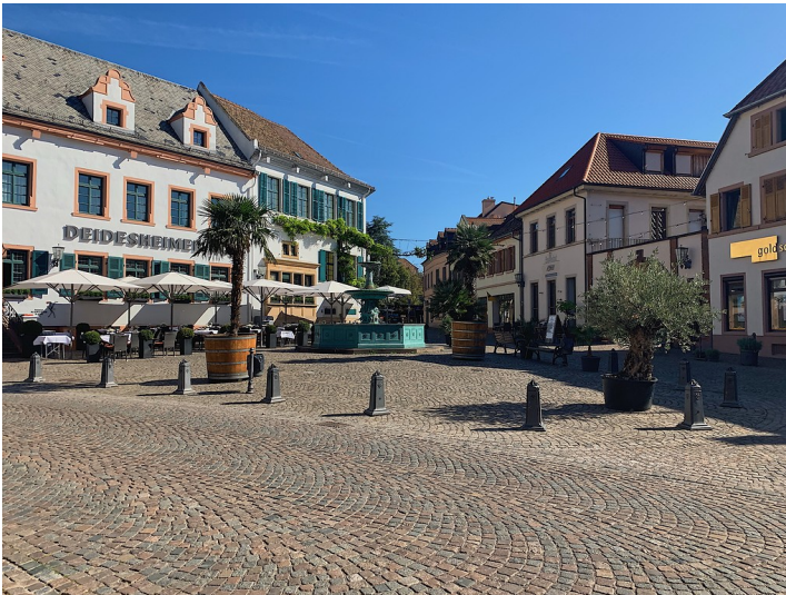
Der Marktplatz von Deidesheim, von der Weinstraße aus (2019)