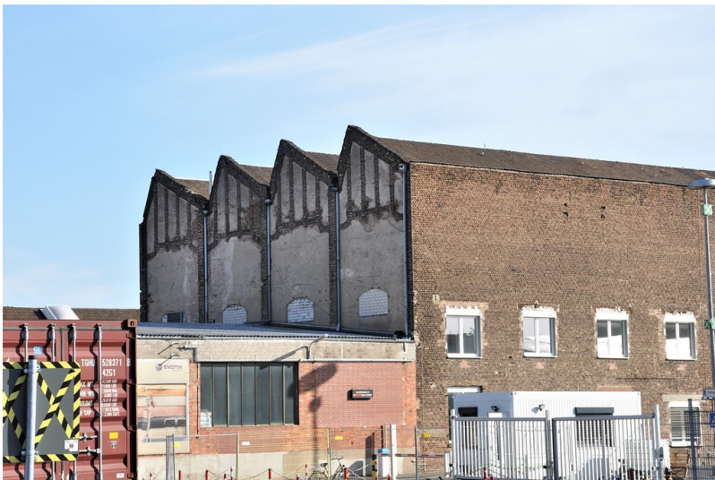
Teile der Fabrikanlage von Evonik in Bonn-Beuel (2019).