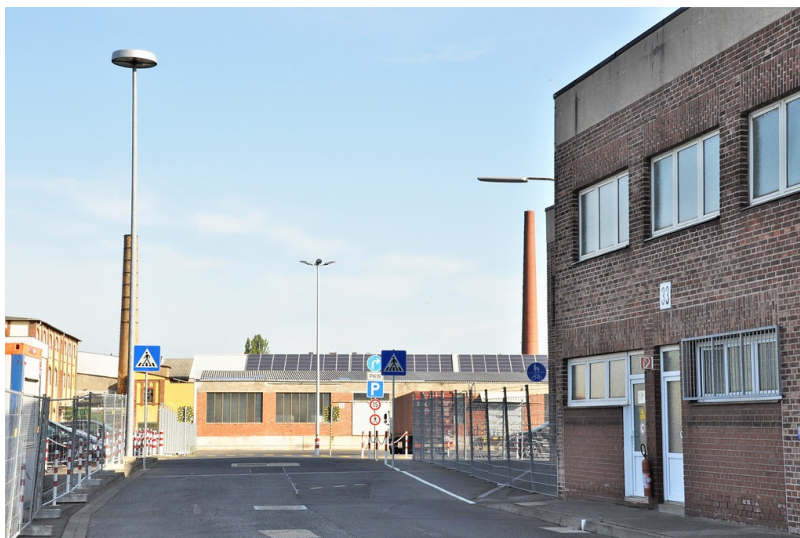
Einfahrt der Evonik-Werke an der Siegburger Straße in Beuel-Ost (2019)