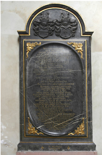
Epitaph für den Kammerarzt Heinrich Christoph Rotberg († 1767) und seine Frau im Dom zu Wetzlar (2019)