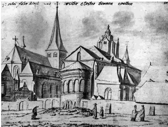
Historische Ansicht der Kölner Kirchen St. Peter (links) und St. Cäcilien (rechts) mit angrenzenden Klosterbauten (Justus Finkenbaum, um 1665). Fotograf/Urheber: Justus Finkenbaum