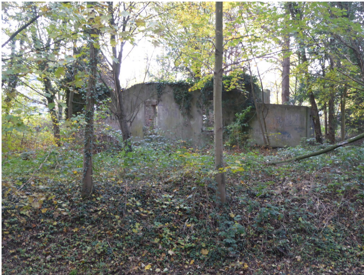
Garather Mühle (2019)