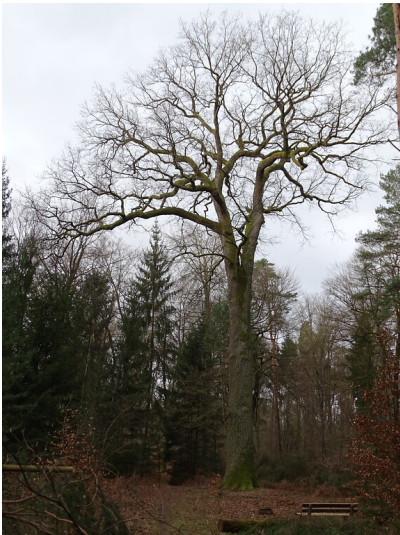
Bismarckeiche im Bienwald