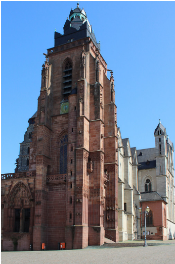
Dom zu Wetzlar (2019)