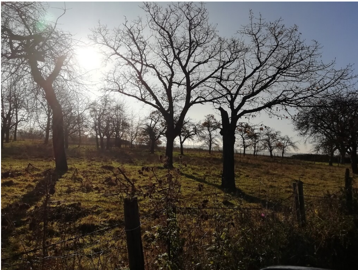
Obstwiese "Hemmerich" in Bornheim (2019)