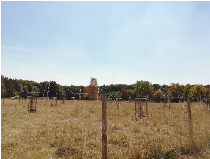
Obstwiese "Am Kleinen Wasserbroich" in Alfter (2018)