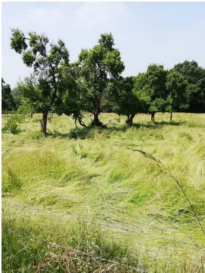
Obstwiese "Im Rosental" in Rheinbach (2018)