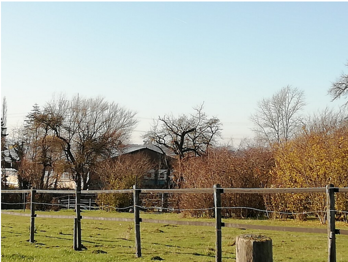
Obstwiese "Rechwiesen" in Wachtberg (2019)