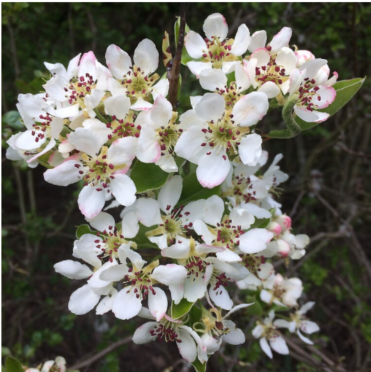
Birnbaumblüten (2021)