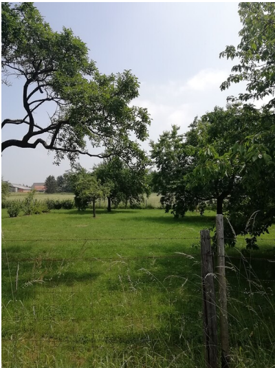
Obstwiese "Herrendriesch" in Rheinbach (2018)