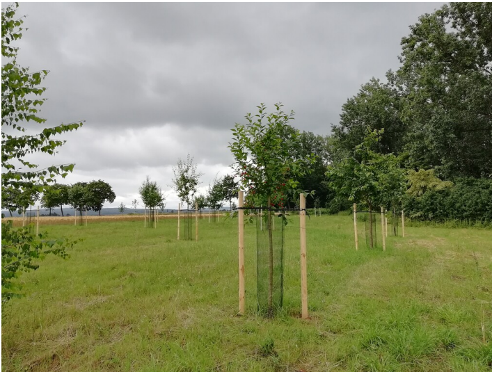
Obstwiese "Benden" in Swisttal (2018)