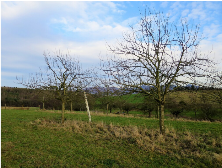
Obstwiese "Siebengebirgsblick" in Wachtberg (2018)